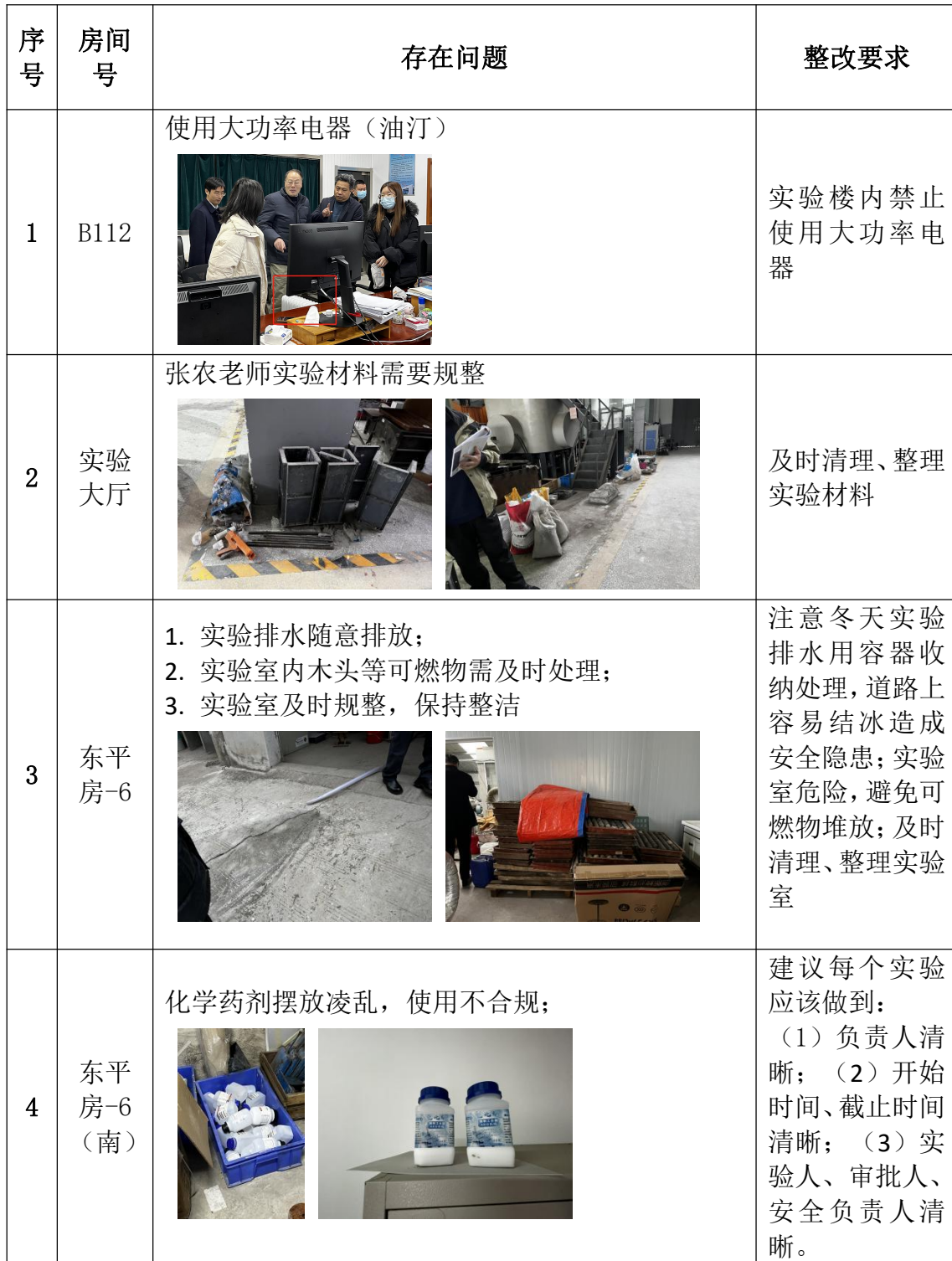
煤炭国重实验室安全检查问题隐患汇总表